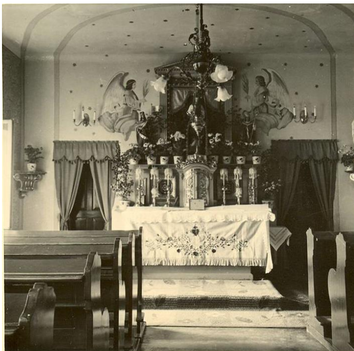
9. Kaple sester v hospodářské budově německobrodské nemocnice