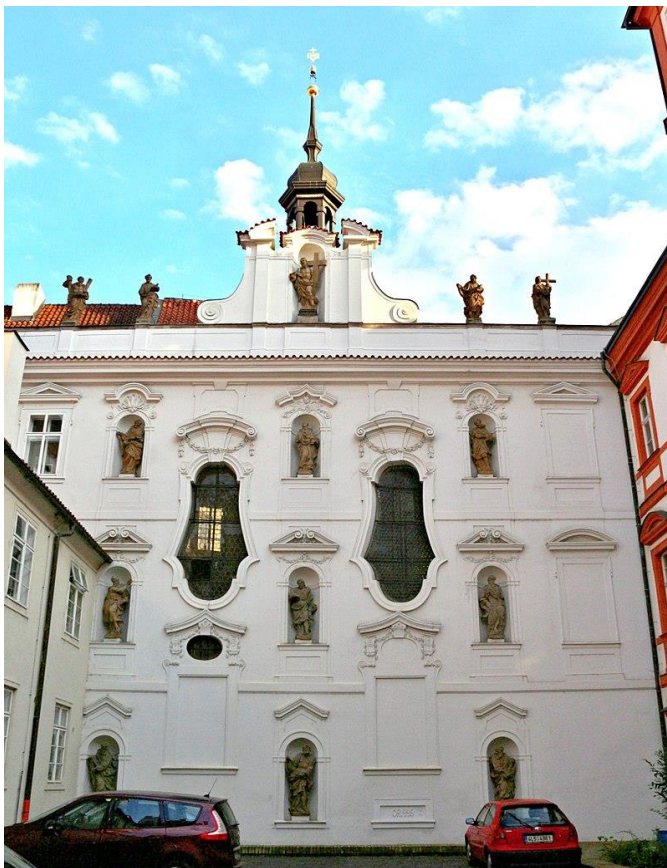
2. Kostel Šedých sester sv. Bartoloměje v Praze