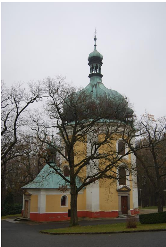
4. Farní poutní kostel Jména Panny Marie v Lomci