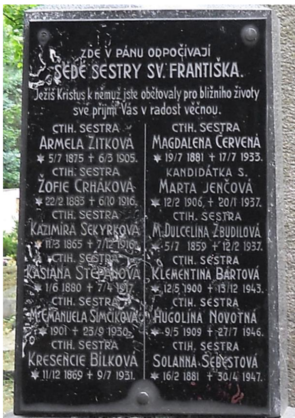
11. Hrob sester na hřbitově u sv. Vojtěcha v Havlíčkově Brodě – detail