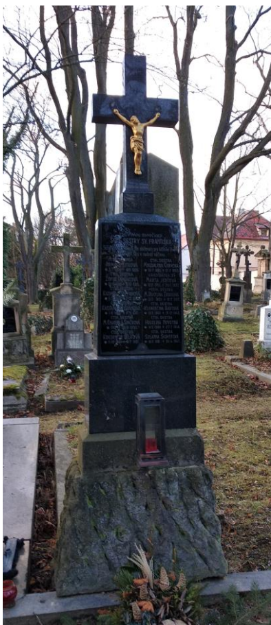
10. Hrob sester na hřbitově u sv. Vojtěcha v Havlíčkově Brodě