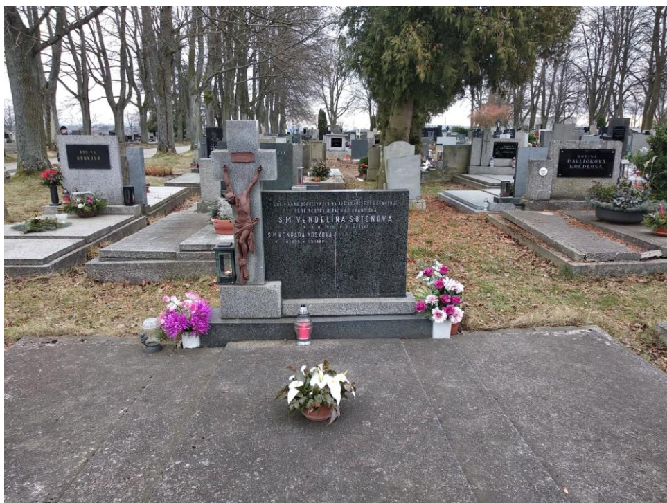
12. Hrob sester na Novém hřbitově v Havlíčkově Brodě