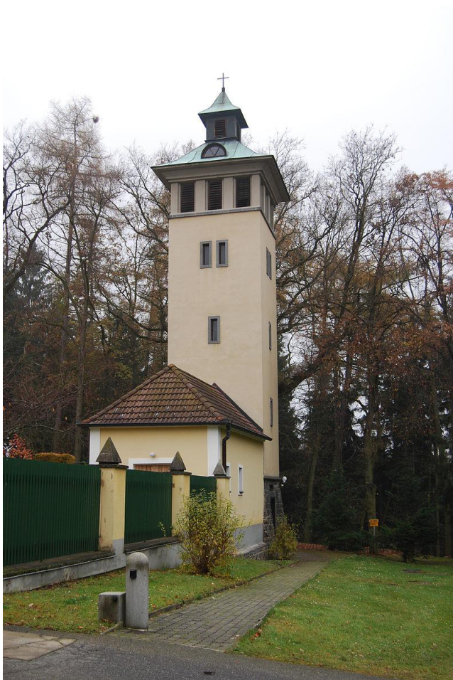
5. Zvonice v Lomci