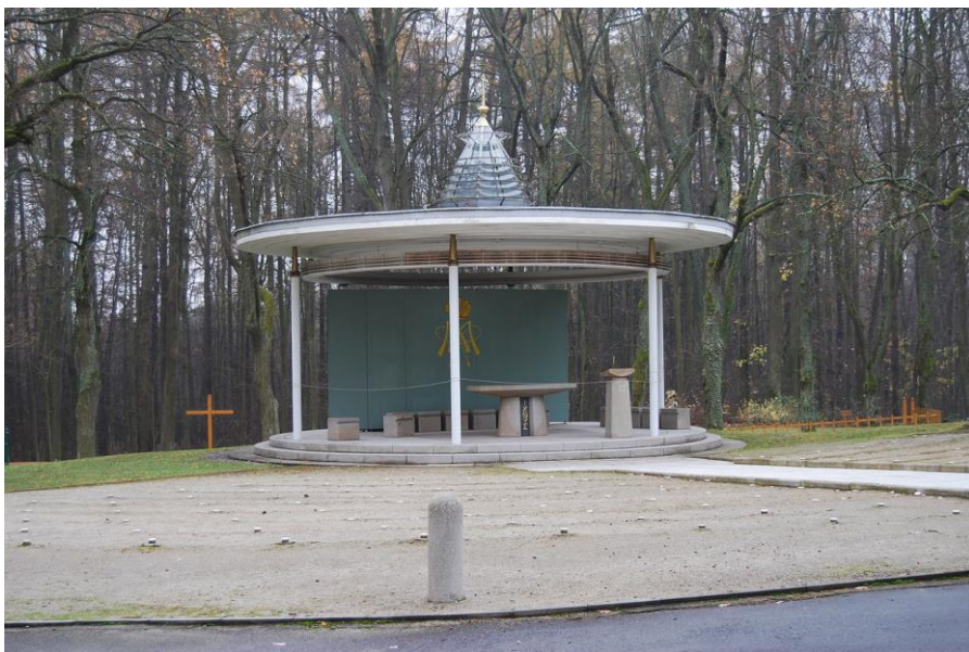
6. Venkovní oltář poutního areálu u kostela Jména Panny Marie v Lomci