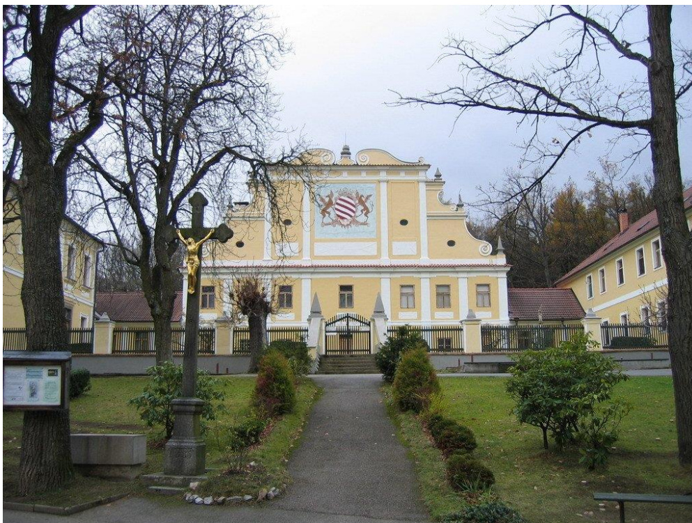
3. Klášter Šedých sester v Lomci